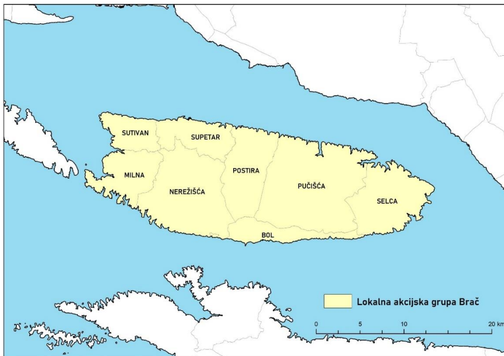
Slika 1: Karta LAG područja s vidljivim granicama JLS-ova u LAG-u