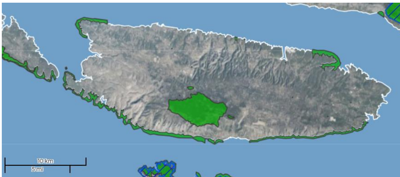
Slika 3: Ekološka mreža Natura 2000 na području LAG-a